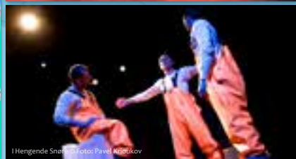
I Hengende Snet