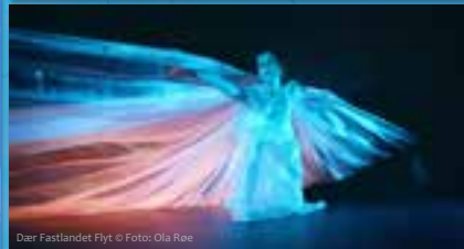
Dar Fastlandet Flyt