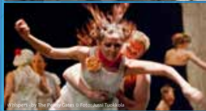
Whispers - by The Peppily Gates