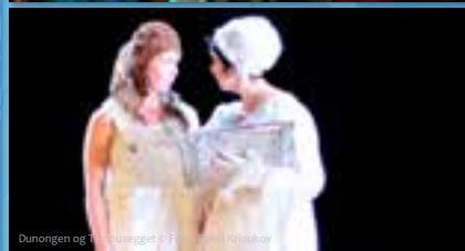
Dunongen og Trollosegget