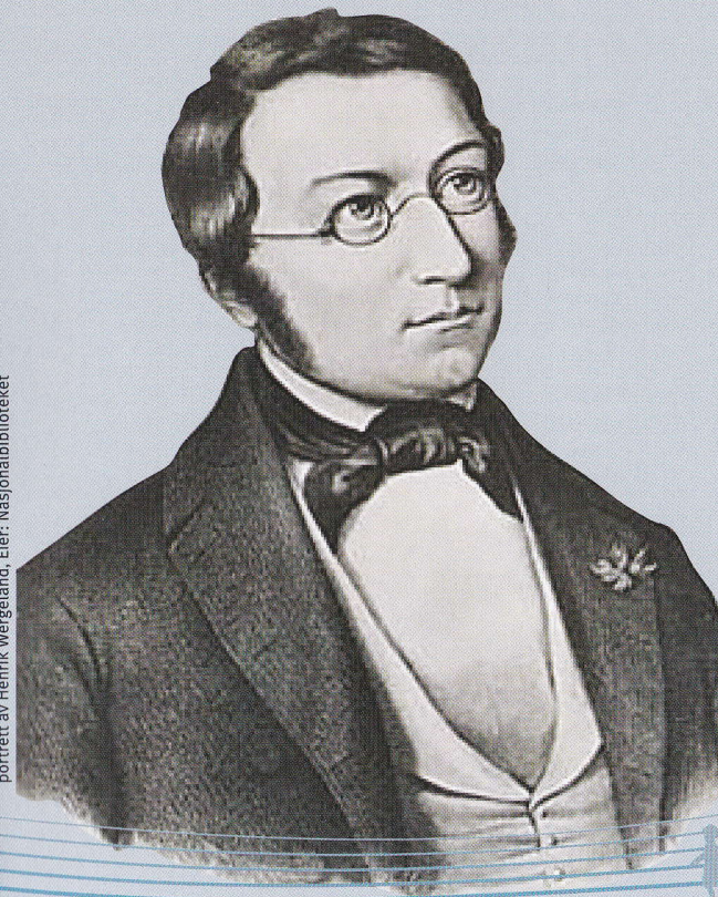
portrett av Henrik Wergeland